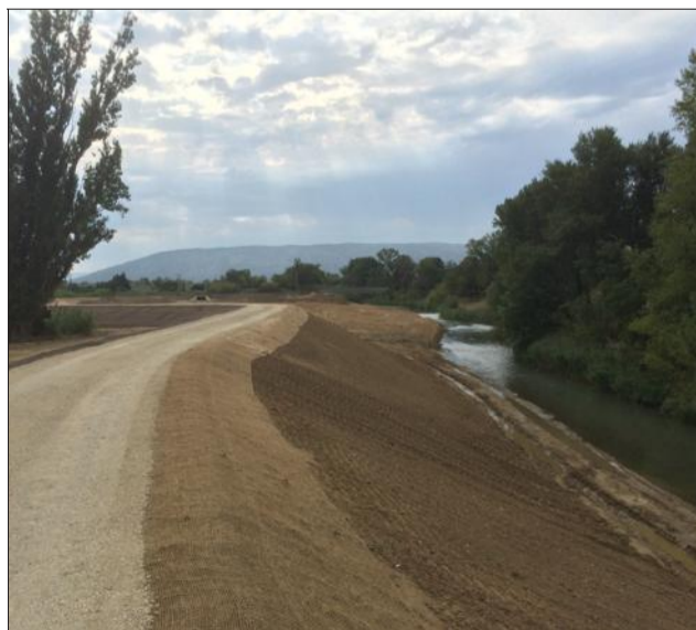
La digue entre le pont-rail de Cavillon et la route de L'Isle-sur-la-Sorgue est terminée.

La tranche 3 s'inscrit dans un programme de sécurisation de onze tranches. Elle comprend aussi un chantier à Robion. Celui de sécurisation du Mur d'Androuin. Les travaux viennent de commencer. Ils doivent s'étaler jusqu'en avril 2017. L'objectif est de consolider ce mur situé dans l'extrados d'un méandre et dont les fondations sont fortement sollicitées lors des crues du Coulon. Les signes apparents de défaillance et les sondages géotechniques réalisés ont conduit le syndicat de rivière à programmer une intervention sur cet édifice dans