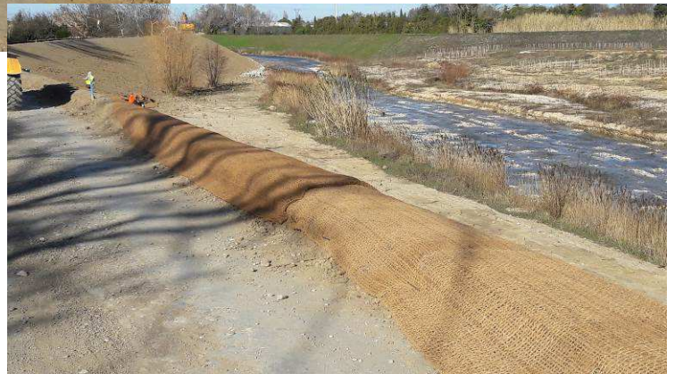
Mise en place de la jute de fibre de coco (protection des talus) + ensemencement.