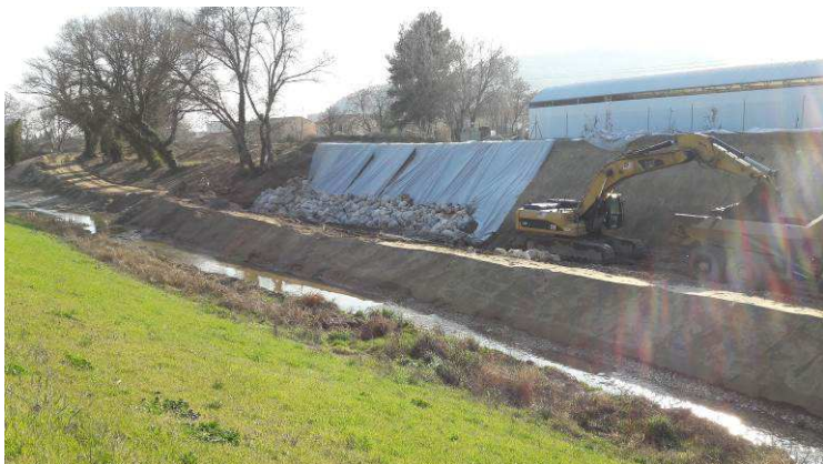
Réalisation de la protection en enrochement au droit de l'entrepôt VIAL