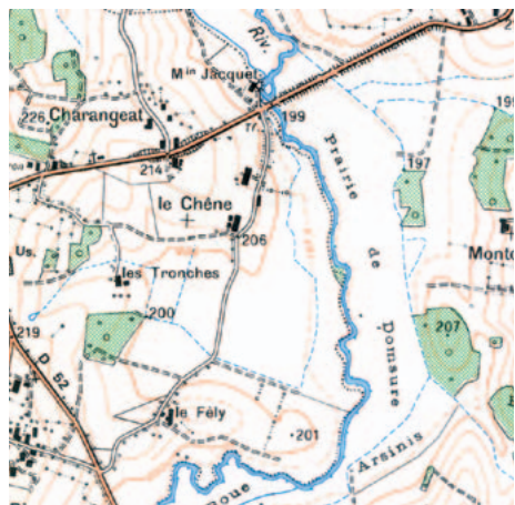
La carte IGN au 1:25 000, constamment remise à jour mais qui n'a rien d'exhaustif, identifie comme cours d'eau les tracés bleus, continus ou intermittents. Toutefois, cette présomption peut être infirmée ou confirmée par des constatations in situ.

L'entretien est nécessaire et obligatoire. Mais des opérations d'entretien mal adaptées peuvent entraîner des dommages difficilement réversibles pour le milieu aquatique et les propriétés riveraines. Par exemple, elle peuvent occasionner un recalibrage du cours d'eau, augmentant la vitesse des écoulements et aggravant les crues en aval, et causer des dégradations du milieu aquatique. Elles relèvent alors de l'aménagement.