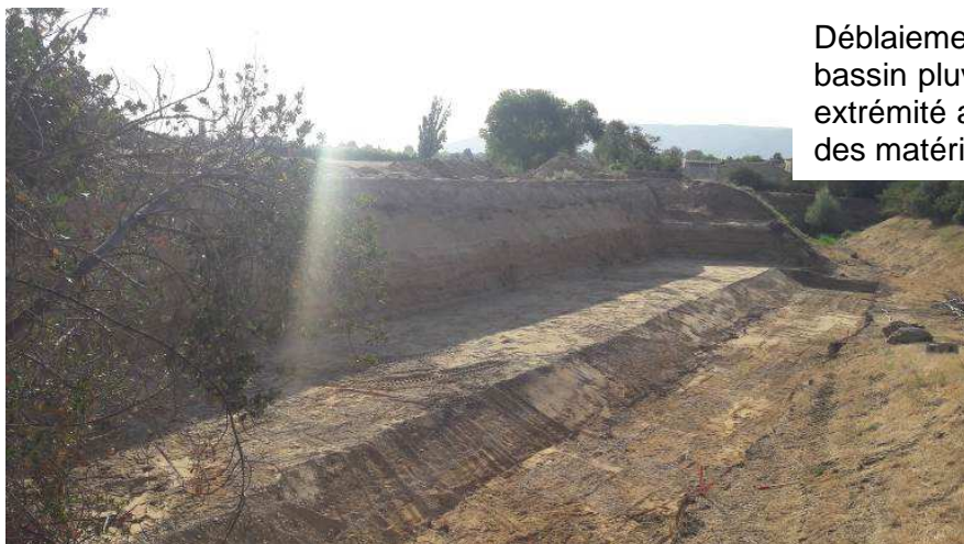
Déblaiement au droit du bassin pluvial des Ratacans, extrémité aval, et évacuation des matériaux