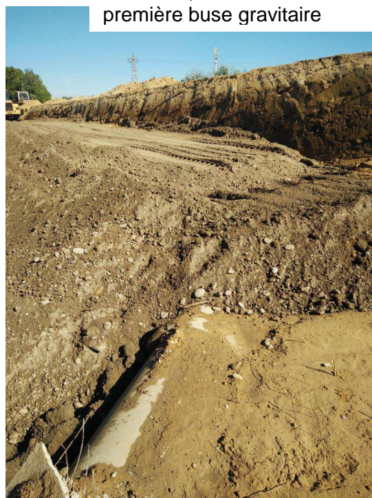
Remblaiement argileux au droit du bassin pluvial des Ratacans, limite amont à la première buse gravitaire